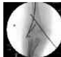
Operativversorgte Epiphysenfugenlösung Oberarm

gen aus, in ganz seltenen Fällen kann es jedoch sogar zu Wachstumsstörungen kommen. Wenn wir auch nicht vom Schlimmsten ausgehen wollen, so ist doch die Aussicht, bei sommerlichen Temperaturen um die 30° wochenlang einen Gips zu tragen, kaum erbauend und sicher kein Spaß – selbst mit der Möglichkeit des Badegipses. Trotz alledem sollte man Kindern nicht die Freude am Springen nehmen. Nur soll das Verletzungsrisiko dieser heutigen Trendsportart aus den 1920er-Jahren mit bestimmten Vorkehrungen reduziert werden. Ein Sicherheitsnetz ist unabdingbar und seine Montage sollte das Erste sein. Wichtig ist auch die nähere Umgebung des Aufstellungsortes. Zäune und Bäume sollten sinnvollerweise weit weg sein. Der Untergrund des Aufbauplatzes muss eben und waagrecht sein. Die Sprungfläche selbst muss unbedingt trocken sein, da man auf einer nassen leicht ausrutschen kann. Entscheidend ist auch, dass man die Kleinen beaufsichtigt und nur ein Springer auf dem Trampolin ist. Und nun auf in einen schönen – und unfallfreien! – Sommer. Dem steht nichts entgegen, wenn unsere Tipps zum sicheren Trampolin-Spaß beherzigt werden.