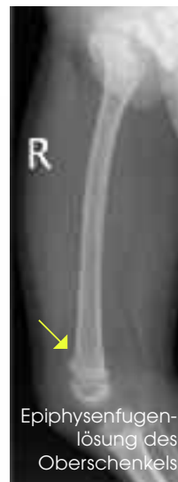
R Epiphysenfugenlösung des Oberschenkels