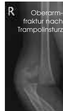
R Oberarmfraktur nach Trampolinsturz